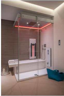
Individuelles Dampfbad mit Dampfpaneel Atlanta und Infrarotpaneel Lissabon