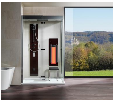
Dampfbad Ventura mit Dampf-Duschpaneel Ventura und Infrarotpaneel Lissabon