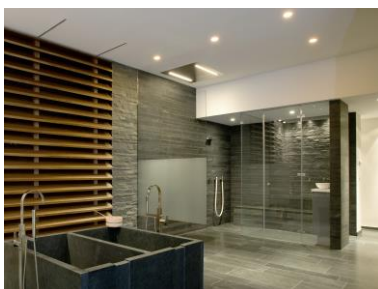
Individuelles Dampfbad mit externer Dampftechnik