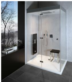
Dampfbad Malta mit Dampfpaneel Malta. Malta wird vor die Wand gesetzt und eignet sich zum Nachrüsten.