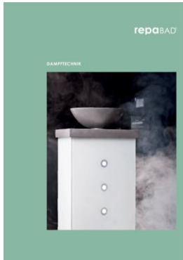
Repabad Titel Dampftechnik Broschüre 2020