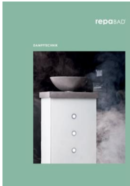
Repabad Titel Dampftechnik Broschüre 2020