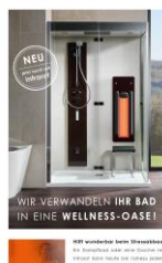
Urlaub Zuhause im eigenen Bad