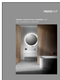
Wannen Barrierefreie Lösungen Whirlpools Waschtische Badmöbel

Badezusätze, Pflege- und Reinigungsmittel für Badewanne, Whirlpool und Dampfbad einfach und schnell bestellen! Bestellformular auf der Homepage ausfüllen und abschicken. Sie finden unser Zubehör unter: www.repabad.com/zubehoer-bestellen