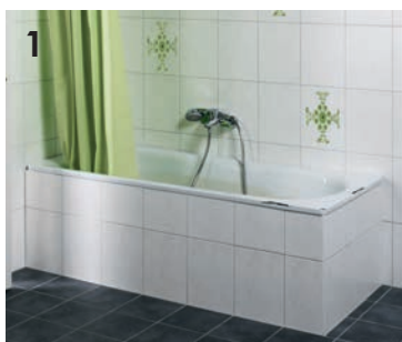
1 Ausmessen der alten Wanne.