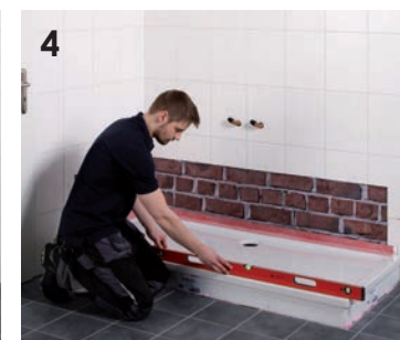
4 Montage der neuen Duschwanne.