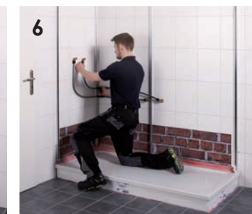
6 Erstellen der Wasseranschlüsse.