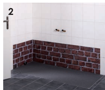
2 Demontage der alten Wanne.