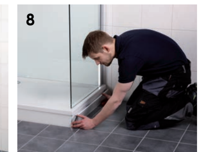
8 Verblendung der Duschwanne.