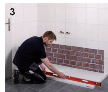
3 Vorarbeiten für die Duschwannenmontage.