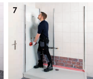
7 Einbringen der Wandverkleidung.