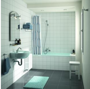
Das „alte“ Bad

Die Ausstattung und Optik ist in die Jahre gekommen. Zum Duschen muss täglich über den hohen Wannenrand gestiegen werden. Stauraum, Ablageflächen und ein Badheizkörper als Handtuchrockner fehlen.